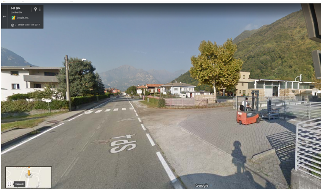
Figura 2 – Ripresa dalla SP4 direzione Chiavenna dell’accesso alla via Fornaci

Tenuto conto del volume di traffico sulla S.P. n. 4 che collega la pedemontana Valtellinese alla SS.36 Valchiavenna, gli effetti indotti dal transito degli autocarri attesi (10 - 15) da e verso l’impianto saranno irrilevanti.