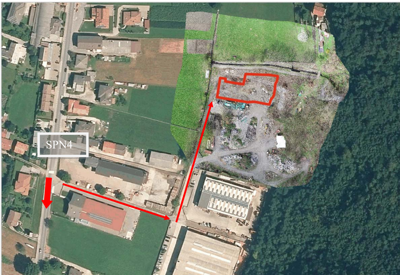
Figura 1 – Viabilità di accesso all’area.

Tenuto conto del volume di traffico sulla S.P. n. 4 che collega la pedemontana Valtellinese alla SS.36 Valchiavenna, gli effetti indotti dal transito degli autocarri attesi (10 - 15) da e verso l’impianto saranno irrilevanti.