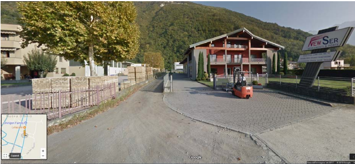
Figura 3 – Ripresa della via Fornaci