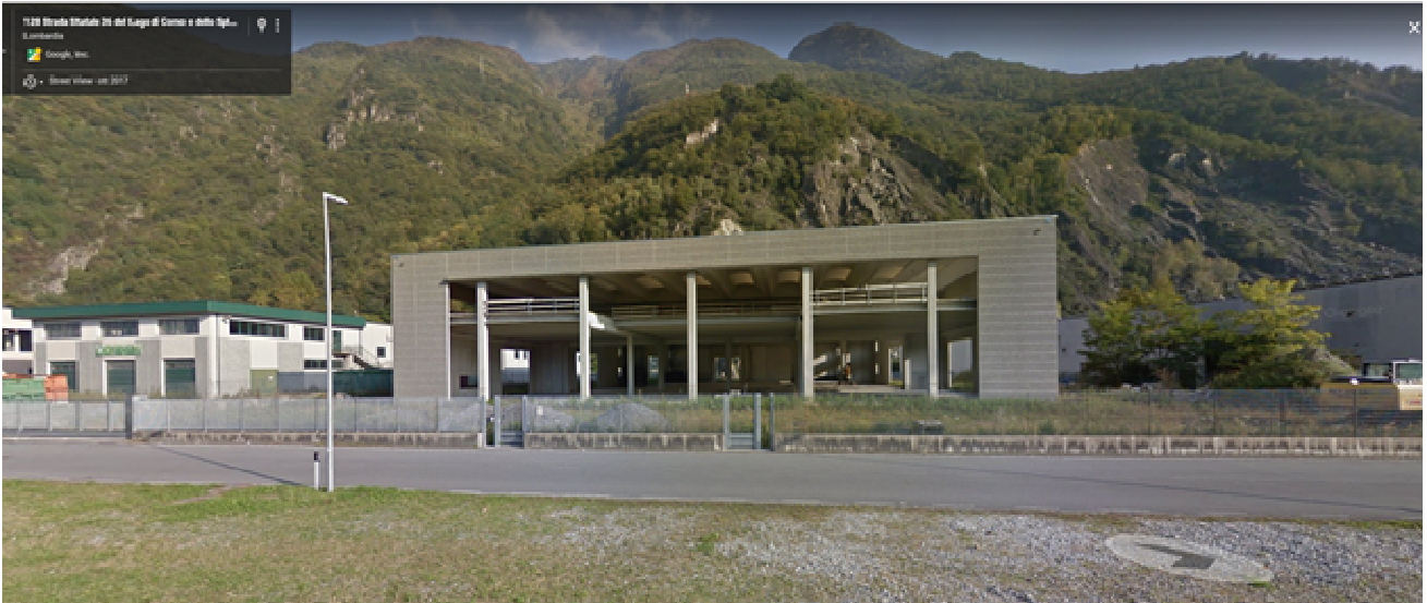
Figura 2 – Capannone oggetto di ordinanza di demolizione

Le fasi di lavorazione possono essere riassunte come segue: