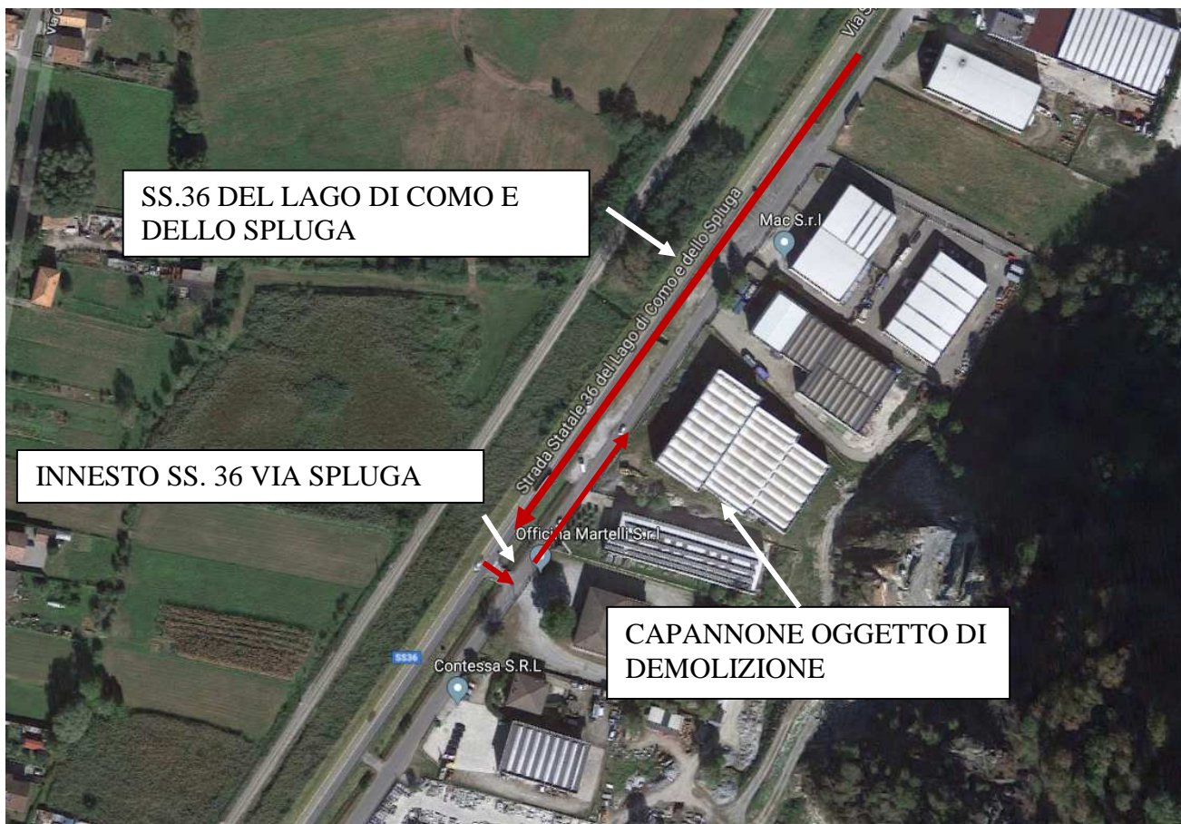
Figura 3 – Percorso mezzi

Tenuto conto del contesto artigianale dell'area e dell'attuale volume di traffico presente sulla viabilità esistente, gli effetti indotti dal traffico generato dall'impianto risultano trascurabili.