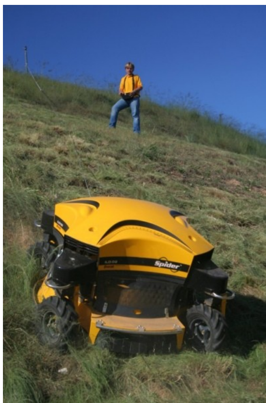
Tosaerba da pendenza radiocomandato, ditta Spider