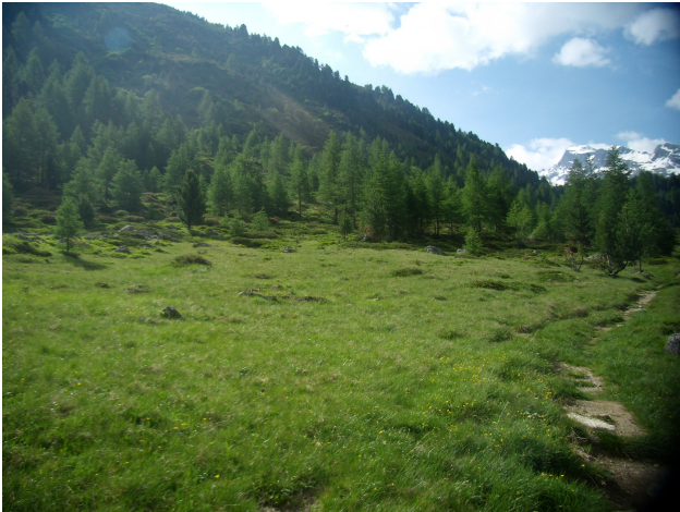
Pascoli sottoutilizzati sul fondovalle