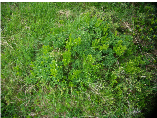
Colonizzazione di mirtillo nero