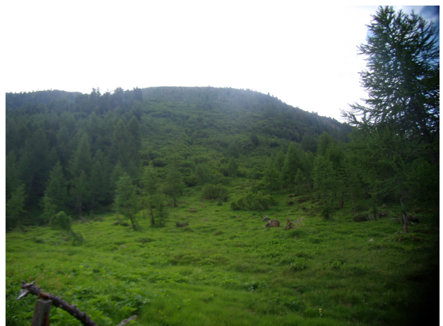
Estesa ontaneta sul versante destro della valle