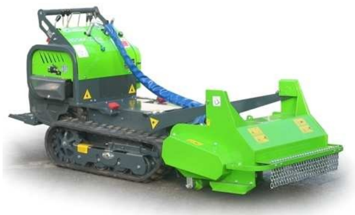
Trinciasarmenti montata su minitransporter cingolato, ditta Merlo S.p.A.