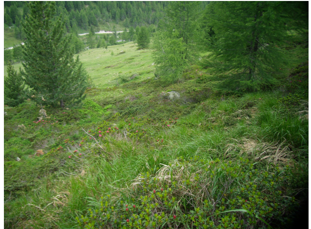
Pascoli abbandonati con rododendro