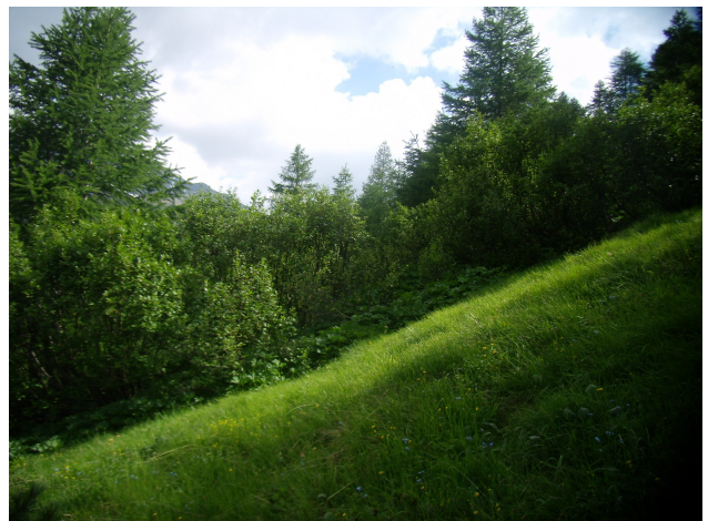
Giovane ontaneta al margine del pascolo