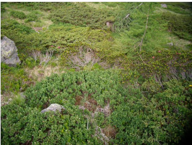
Colonizzazione di ginepro e rododendro